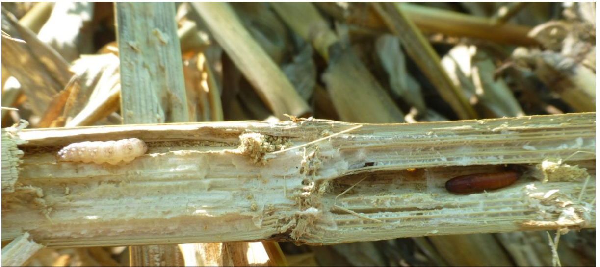
À gauche pyrale encore sous forme de larve, à droite sous forme de nymphe

Malgré cela, le vol de pyrale reste de faible intensité. Il est donc encore trop tôt pour intervenir contre la pyrale si l'on a retenu un traitement chimique au stade « larves baladeuses ». Dans le cas où le maïs ne permet plus le passage d'un matériel classique, il faut absolument rechercher un matériel plus adapté type enjambeur, automoteur plutôt que de traiter trop tôt. Et surtout toujours laisser un Témoin Non Traité.