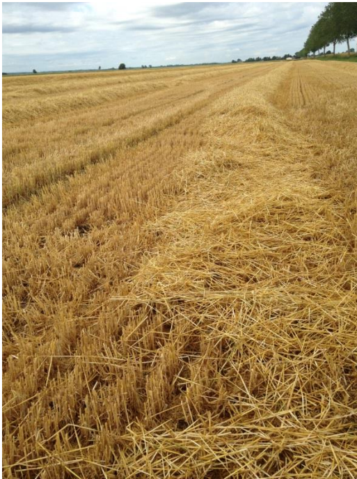
Parcelle d'orge d'hiver récoltée avant le 20 juin à Chemin.