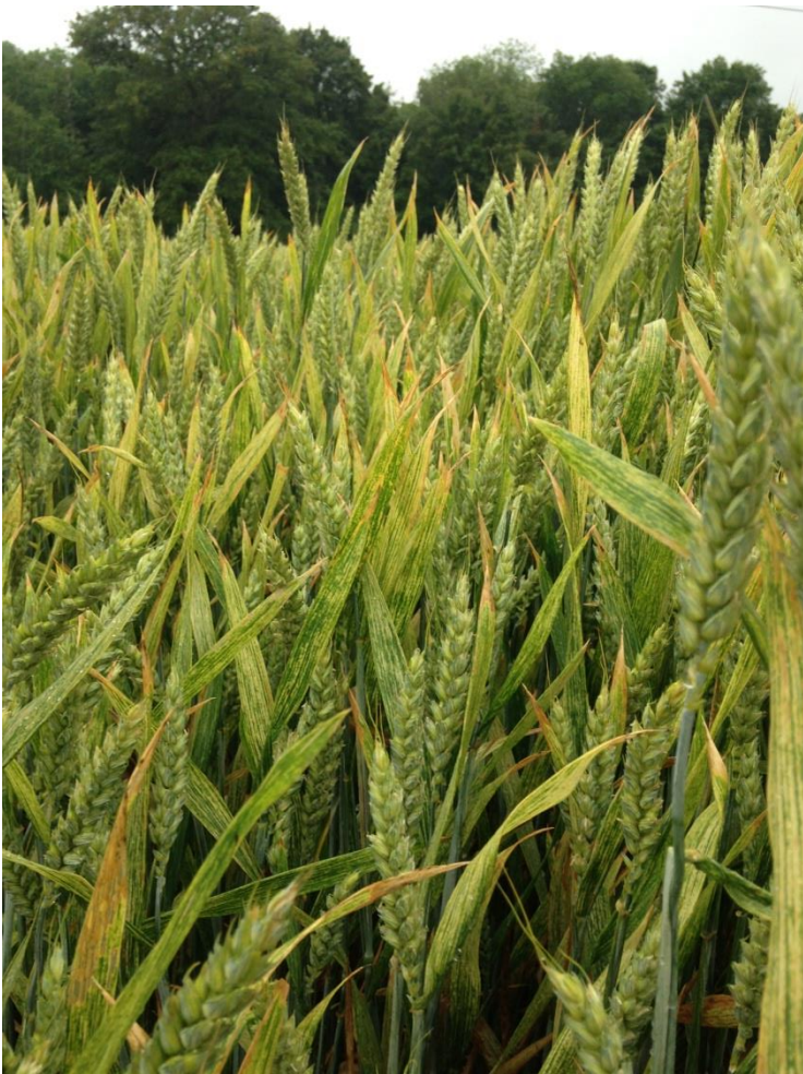
"Jaunissement" vue de plus près avec blé nanifié au premier plan mais dont les épis semblent corrects.

A l'inverse, certaines parcelles où l'on notait une forte présence de pieds chétifs à l'entrée et la sortie de l'hiver et où l'on pouvait craindre le pire, présentent actuellement des densités épis correctes ou presque.