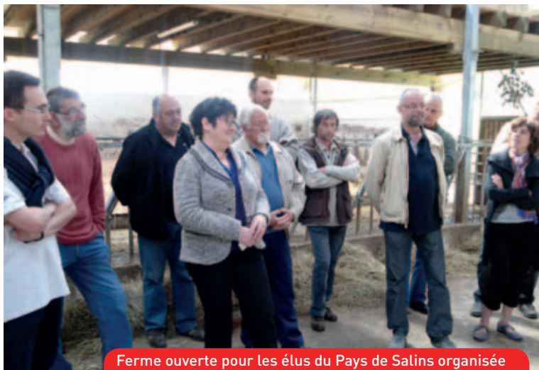
Ferme ouverte pour les élus du Pays de Salins organisée par le GVA de Champagnole Salins en partenariat avec la Chambre d'Agriculture du Jura